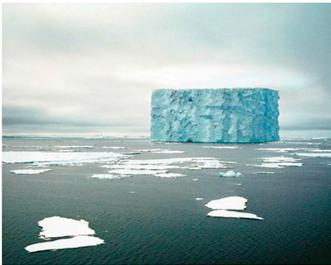
Semlaga bilder av: Ville Lenkkeri, "Existence Doubtful", Kerber 2014, 206 sidor.

kit i havet på grund av vulkanisk aktivitet? Ännu på 1800-talet var den utmärkt på sjökort, men på grund av öskärbenet som dens existens i släpvråden försedd med noteringen "E.D." vilket kan utläsas som existence doubtful .